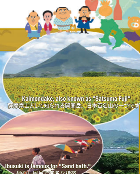
Kaimondake, also known as "Satsuma Fuji" 薩摩富士として知られる開聞岳。日本百名山の一つです。